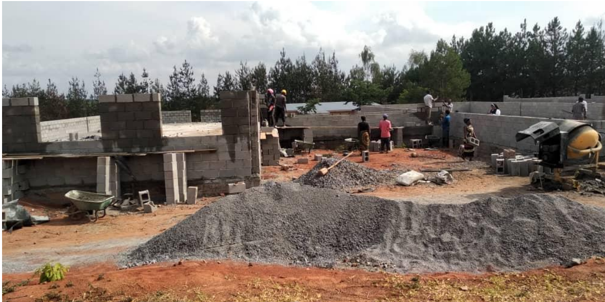
Bouw van het kraamziekenhuis - gestart in maart 2022

kraamziekenhuis), een gastenverblijf voor de familieleden van de vrouwen die meekomen om de vrouwen te begeleiden gedurende de bevalling (inclusief buiten keuken, wasruimte), eetgelegenheid/winkeltje en een afvalverwerkingsgebouw (voor scheiden en verwerking van (medisch) afval).